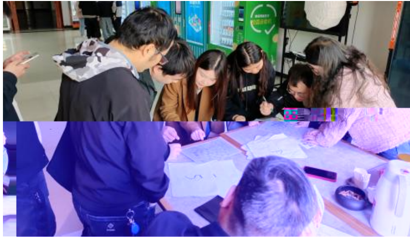
图 卓越团队建设共识营